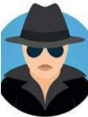
Ema Geht, GRAPHIK FOTOLIA

Spiel, Spaß und Spannung sorgen dafür, das hier tatsächlich, in wenigen Wochen, p o s i t i v e Veränderungen geschehen!