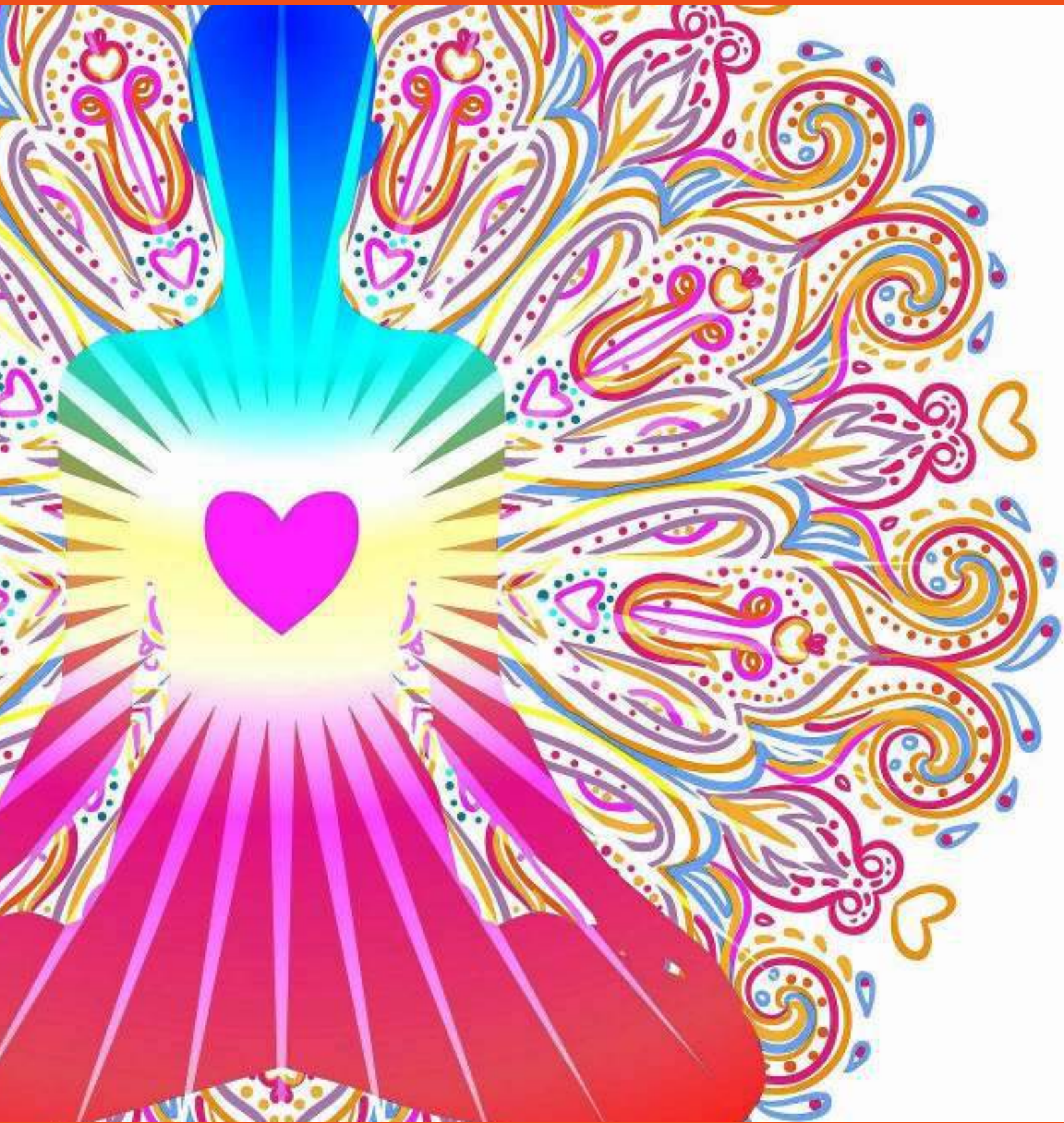
Das Herz Chakra - inneres Licht, Liebe und Frieden