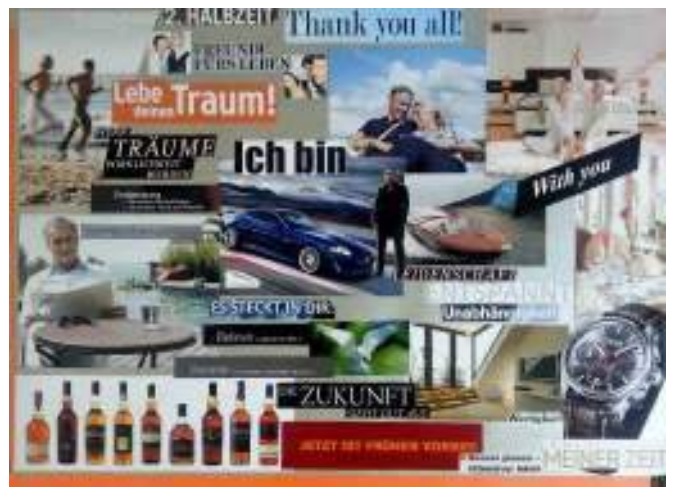
Collage by Hajü

Lasst Euch überraschen und freut Euch auf weitere, spannende Informationen rund um das Thema Persönlichkeits--Entfaltung und HerzEnergie! Wir freuen uns, mit tollen Menschen unvergessliche Tage zu erleben.